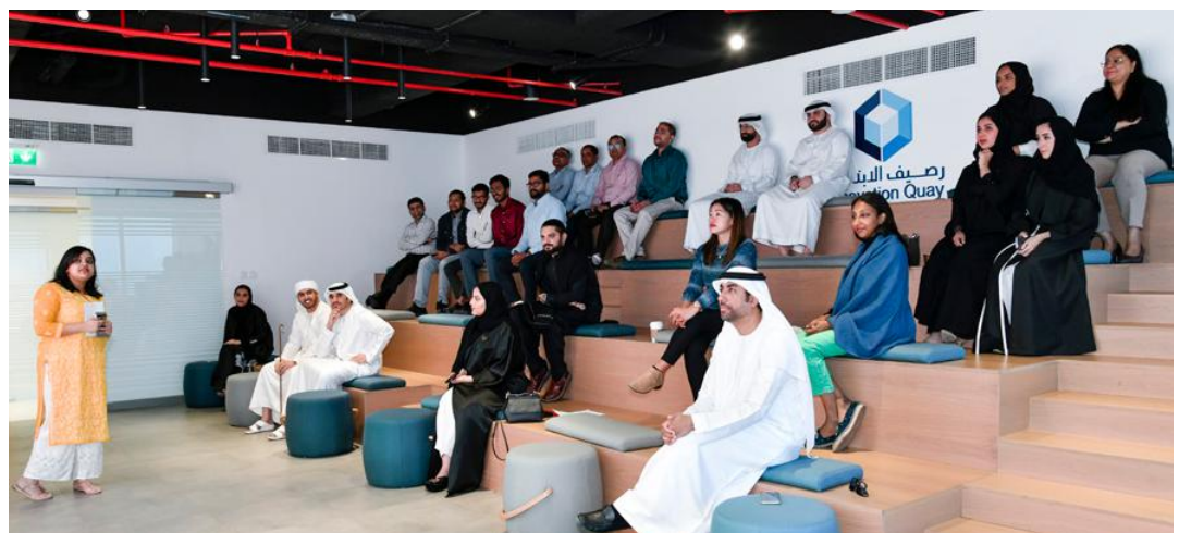
Finance Dept. Culture of The UAE, India &amp; Pakistan إدارة المالية - ثقافة دولة الإمارات، والهند وباكستان