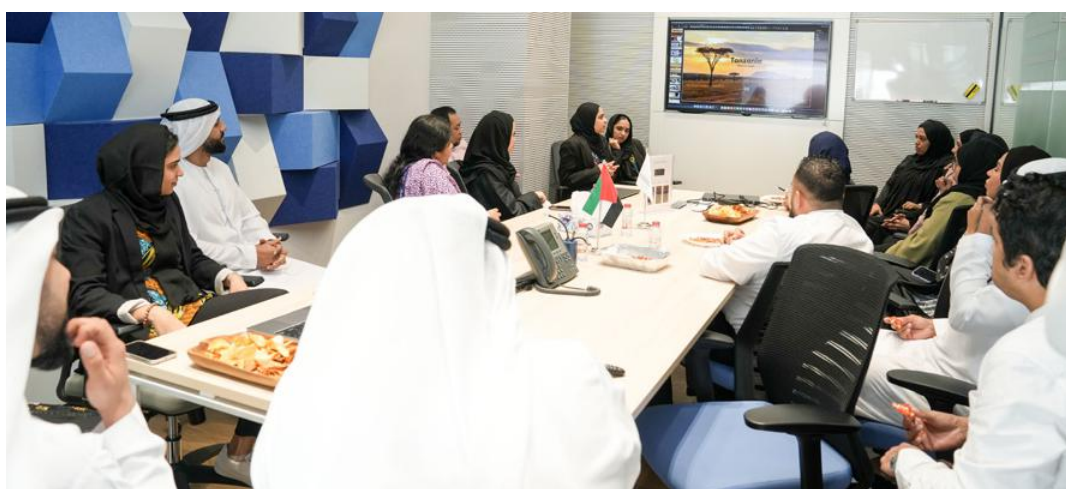
Finance Dept. and S &amp; C Dept. - The Culture of Tanzania