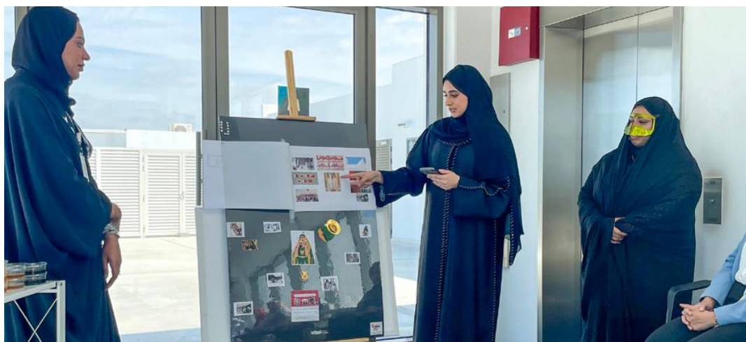
S &amp; C Dept. - The Culture of the UAE