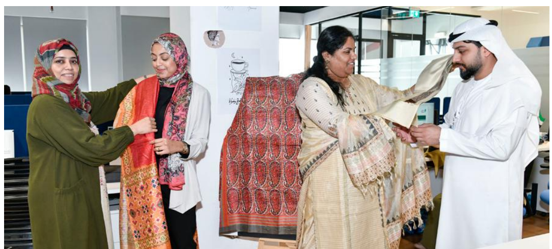
S &amp; C Dept. - The Culture of India