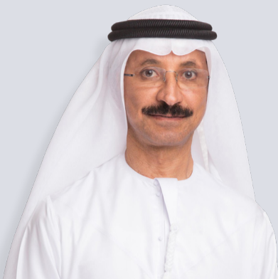
سعادة سلطان أحمد بن سليم رئيس مؤسسة الموانئ والجمارك والمنطقة الحرة H.E. Sultan Ahmed bin Sulayem Chairman of Ports, Customs and Free Zone Corporation (PCFC)

في يوم زايد للعمل الإنساني، نخلد معاً إرث الأب المؤسس، المغفور له بإذن الله الشيخ زايد بن سلطان آل نهيان، "طيب الله ثراه" ورؤيته للعطاء والتسامح والإنسانية. واستلهاماً من هذه القيم، نؤكد في مؤسسة الموانئ والجمارك والمنطقة الحرة التزامنا بدعم القضايا الخيرية والعمل الإنساني من أجل الارتقاء بالمجتمع، ونشر قيم التسامح والعطاء، ومواصلة العمل وفق نهج الشيخ زايد.