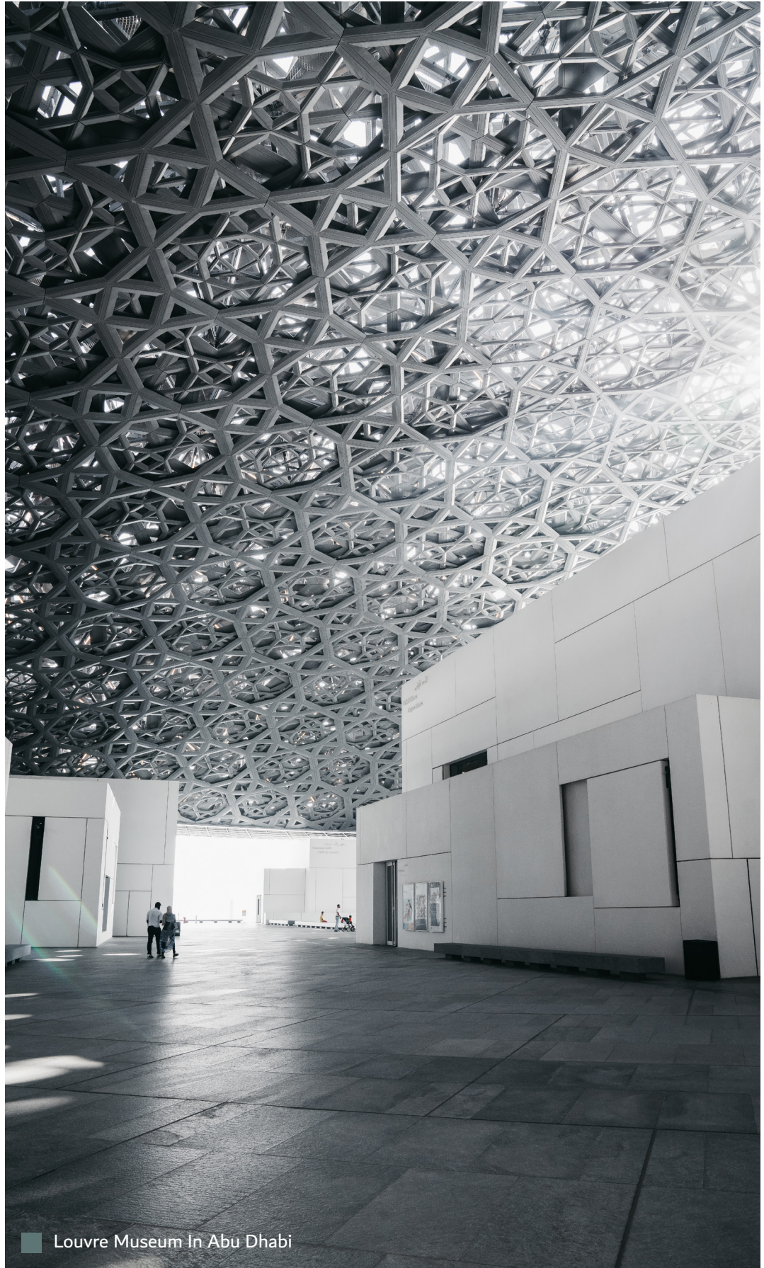
Louvre Museum In Abu Dhabi